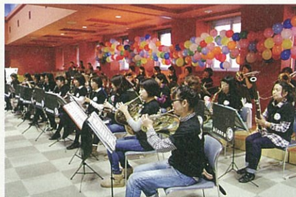
ママプラスブランコ

TBS報道局に3年間所属し、報道レポーターとして活躍の後、フジテレビ「ひらけ!ポンキッキ!」の8代目のお姉さんとして約3年間出演。つくば市在住後も、学会・レセプション等さまざまなジャンルの司会、企業・子供向けのVTR・ナレーションを多数担当。つくば市より「文化振興功労者表彰」受賞。